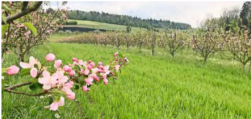
Kombination von Apfelbäumen und Winterhafer bei Strauss Bioagrikultur in Rickenbach ZH.

Der Kombination von Bäumen und Ackerkulturen oder Wiesland sind keine Grenzen gesetzt. 50 Landwirte haben sich am ProBio-Anlass bei Jürg Strauss in Rickenbach ZH informiert. Um den weiteren Austausch zu fördern, wird ein Arbeitskreis gegründet.