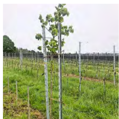
Baumhasel im Rebborg bei Strauss Bioagrikultur in Rickenbach ZH.