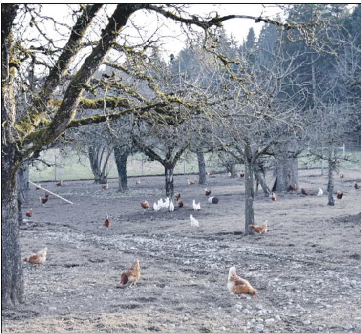
Agroforst funktioniert auch mit Tierhaltung. Im Bild werden Hühner in einem Areal mit Hochstamm-Obstbäumen gehalten.

Weitere News auf www.bauernzeitung.ch BAUERNZEITUNG ONLINE