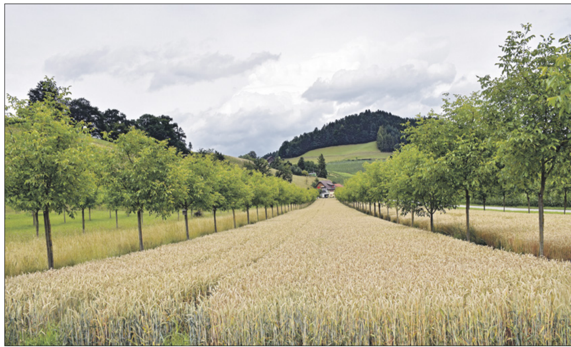
Agroforst funktioniert auch in Kombination mit Ackerbau. Hier sollte beachtet werden, dass der Ackerstreifen 24 bis 26 m breit ist.